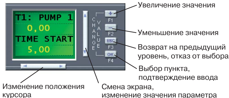
Рис. 3. Работа с кнопками управления логического модуля

Для корректировки параметров в логическом модуле, откройте дверь шкафа, включите рубильник (с помощью дополнительной ручки внутри шкафа), убедитесь, что автомат QF1 включен, на дисплее логического модуля есть изображение, и в третьей строчке экрана отображается режим работы модуля: STOP или RUN – заводская установка. Далее необходимо произвести следующие действия: