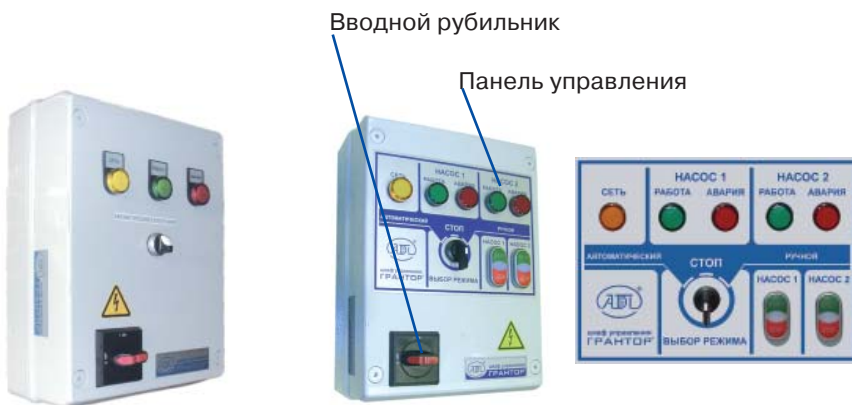
Рис. 1. Вид передней панели шкафа на один электродвигатель